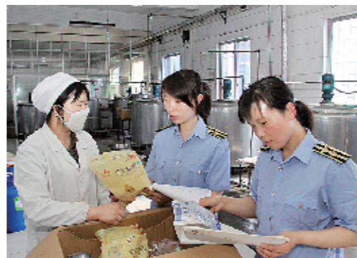
近日,新郑市卫生局联合相关单位,在生产、流通、销售各个环节严防非法添加非食用物质和滥用食品添加剂的行为。图为执法人员在检查某饮料企业生产中食品添加剂是否符合国家标准。