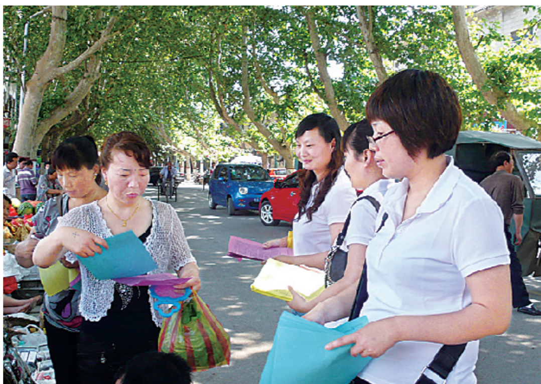
近日,巩义市食品药品监督管理局在全市21个镇(街道办事处)开展为期1个月的食品药品安全知识宣传月活动。图为工作人员在米河镇集贸市场发放食品药品安全知识宣传册。

这次专项检查的重点检查对象是中药饮片经营、使用单位。检查内容主要以中药饮片购销量、使用量较大的品种为重点,检查是否有违法经营、使用中药饮片和销售伪劣中药饮片等违法行为;有无真实完整的验收记录;中药饮片是否具有药品经营质量管理规范认证证书的合法企业购进,索证是否齐全;中药饮片质量是否符合规定;是否有擅自加工中药饮片以及中药饮片是否有受潮、霉变、虫蛀、变质等情况。截至目前,此次专项检查已出动执法人员36人次,检查单位16家,对个别单位存在的中药饮片购进未建立完整验收记录问题,他们已责令相关单位限期整改。